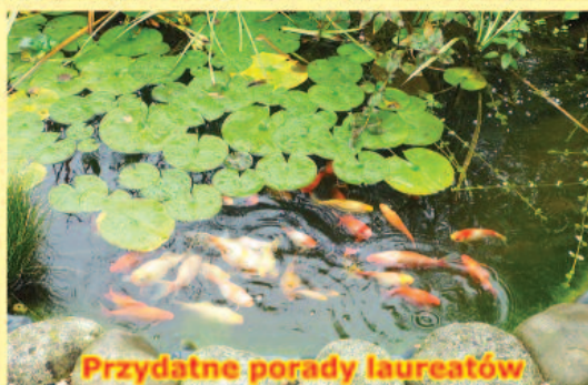
Przydatne porady laureatów